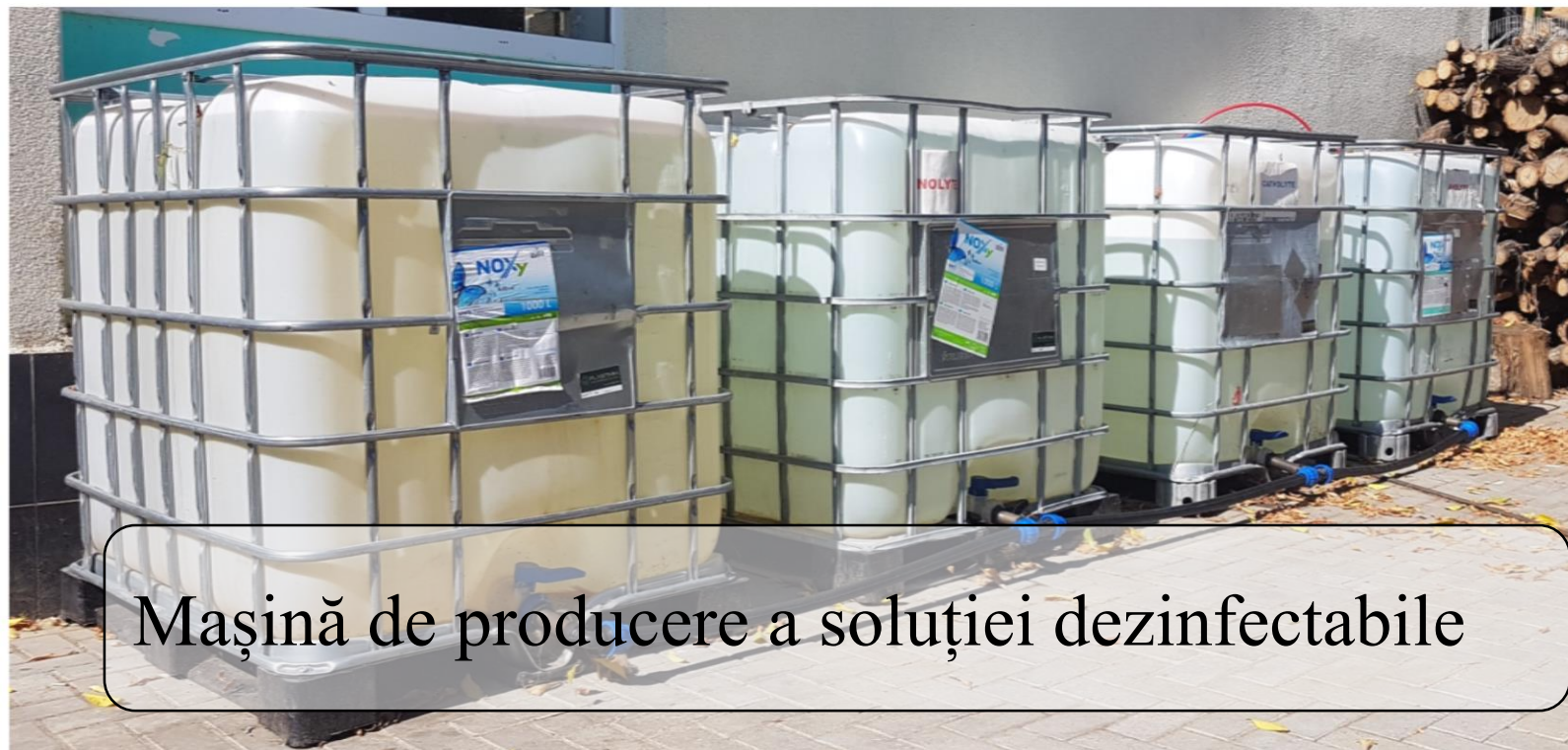
Mașină de producere a soluției dezinfectabile