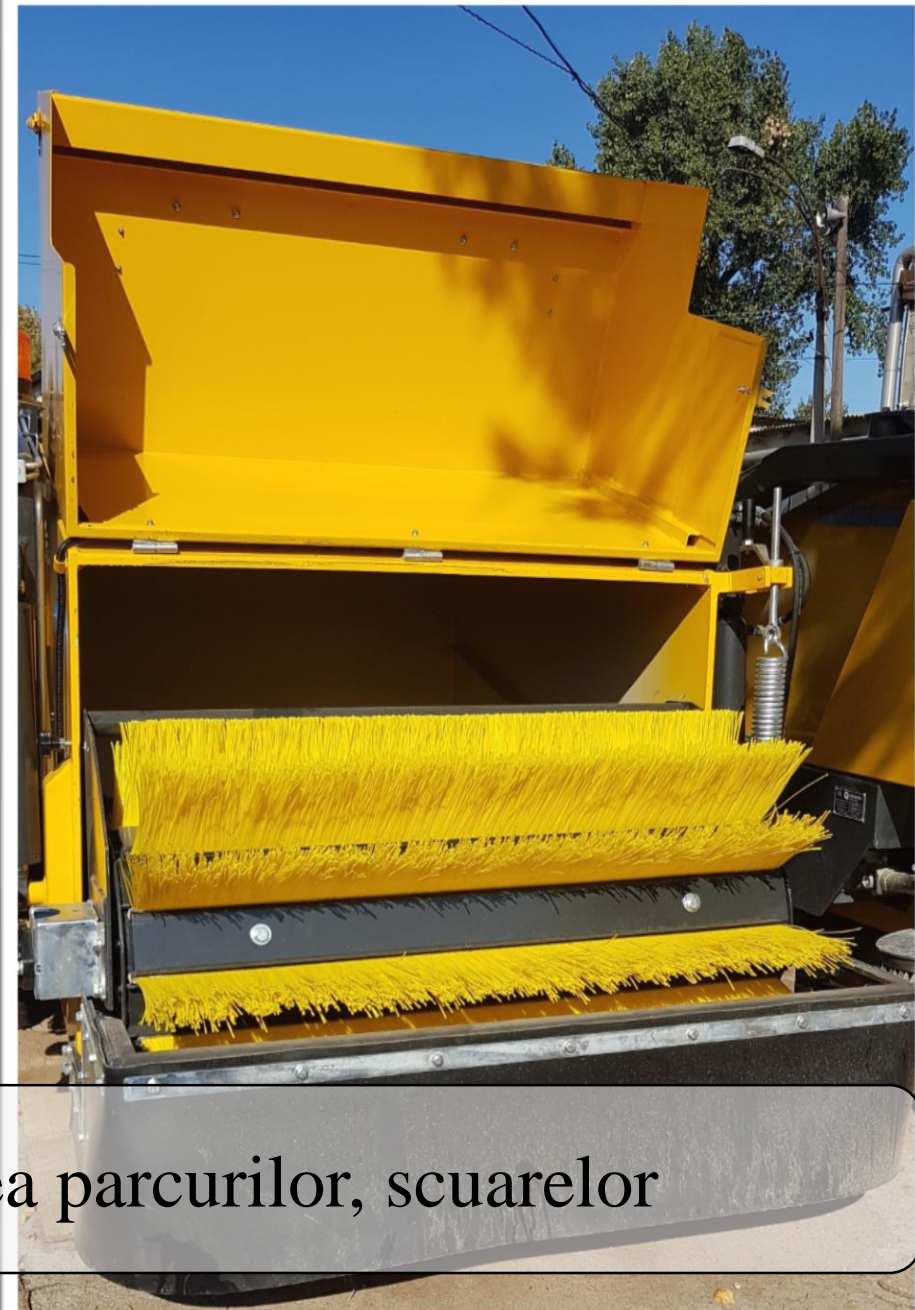
Utilaje tractate pentru salubritatea parcurilor, scuarilor