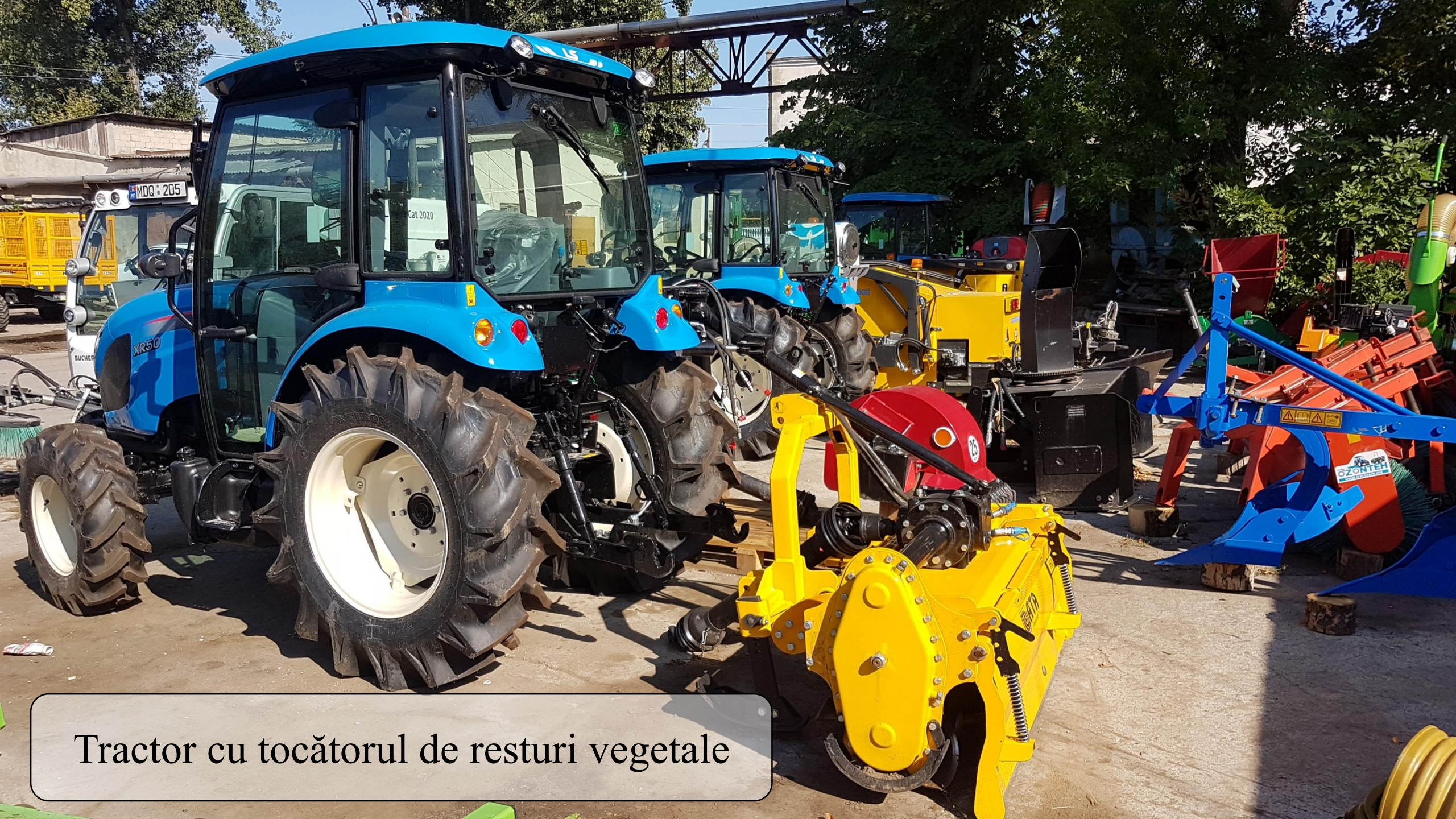
Tractor cu tocătorul de resturi vegetale