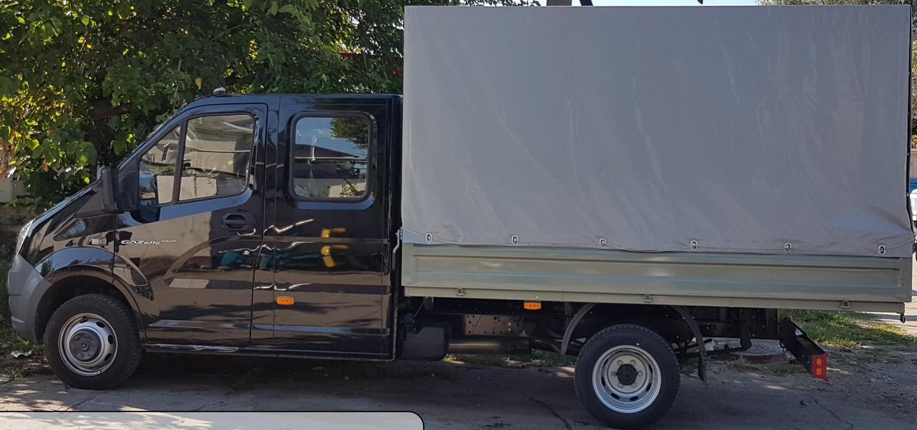
Automobil GAZ A22R32-70