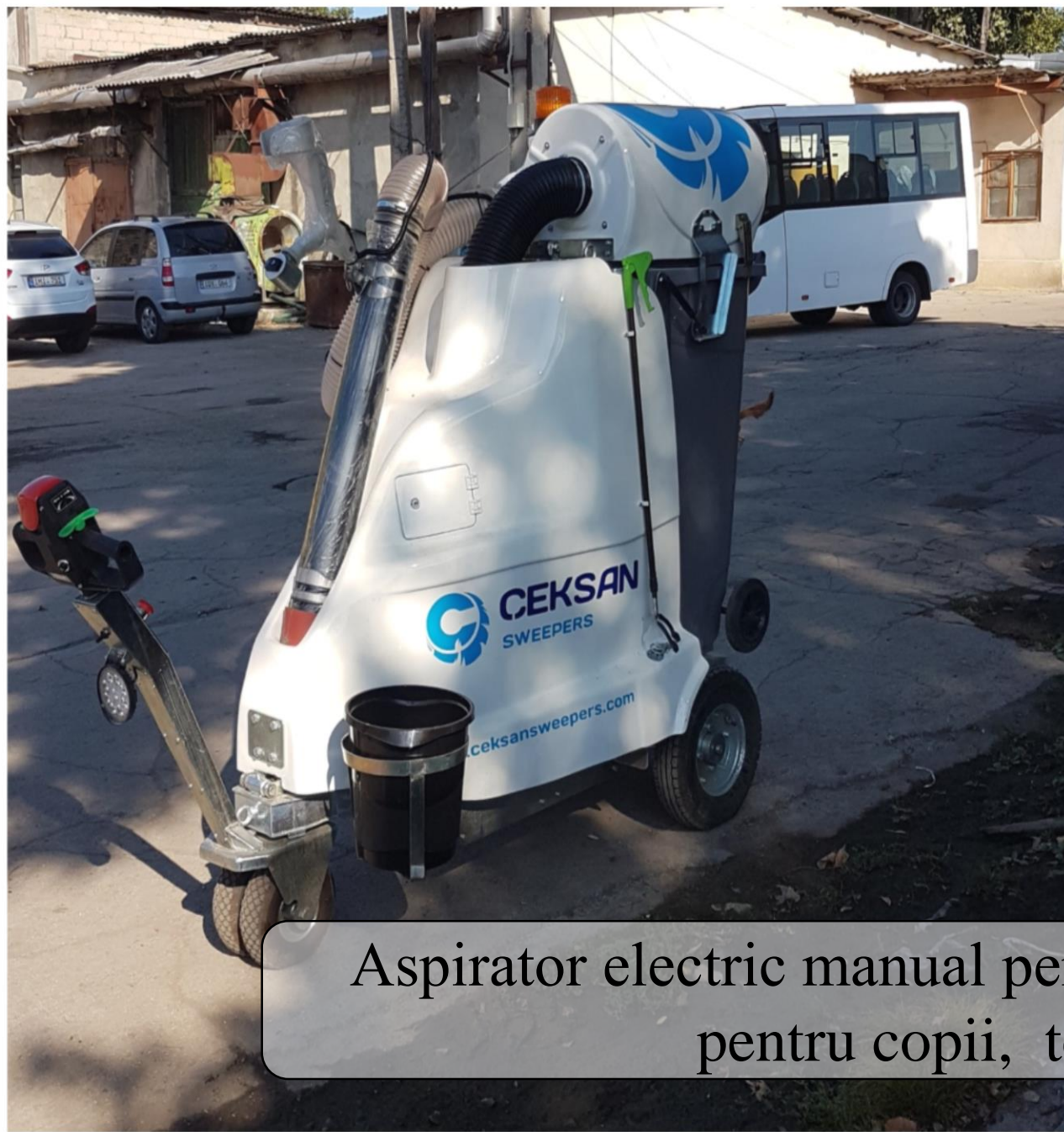
Aspirator electric manual pentru parcuri, terenuri de joacă pentru copii, terenuri sportive