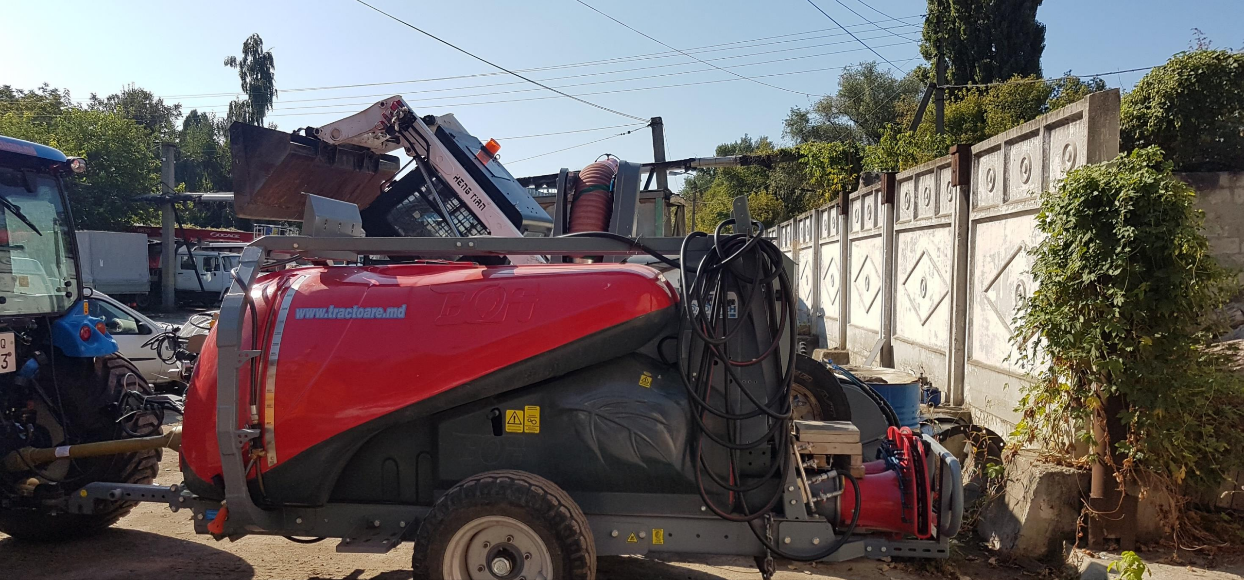
Stropitoare sistem de inducție electrostatică