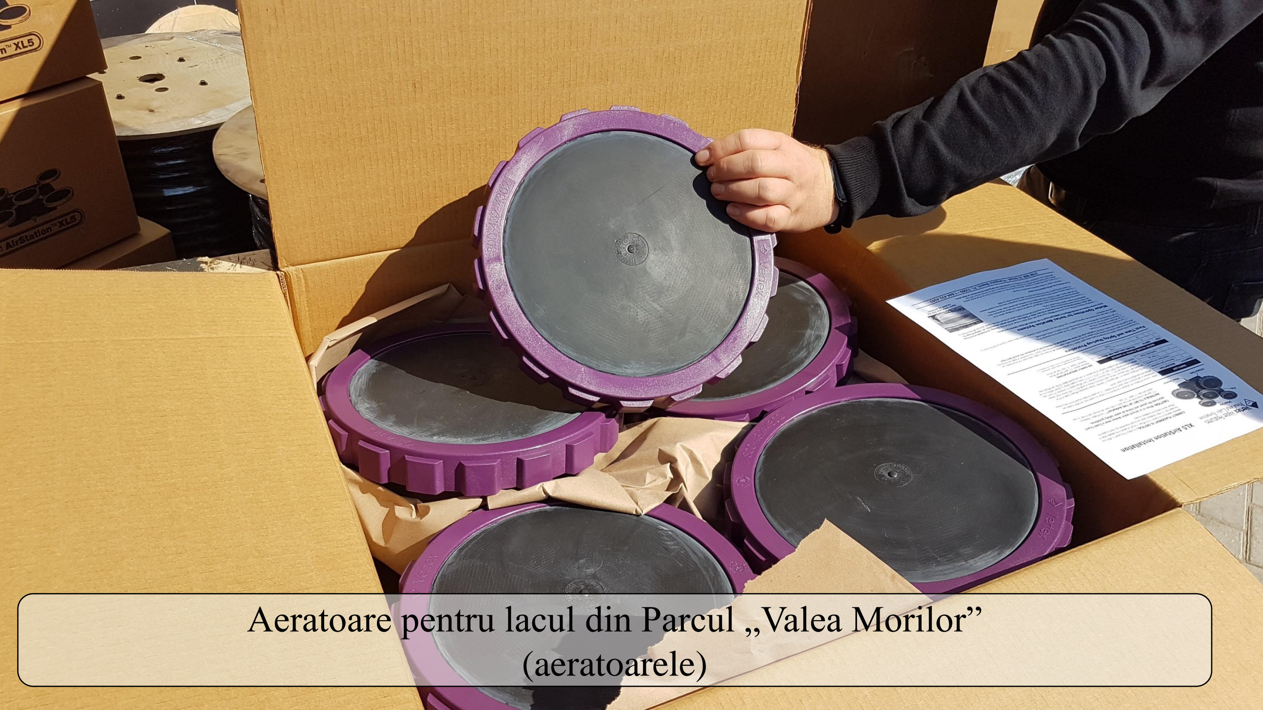
Aeratoare pentru lacul din Parcul „Valea Morilor” (aeratoarele)