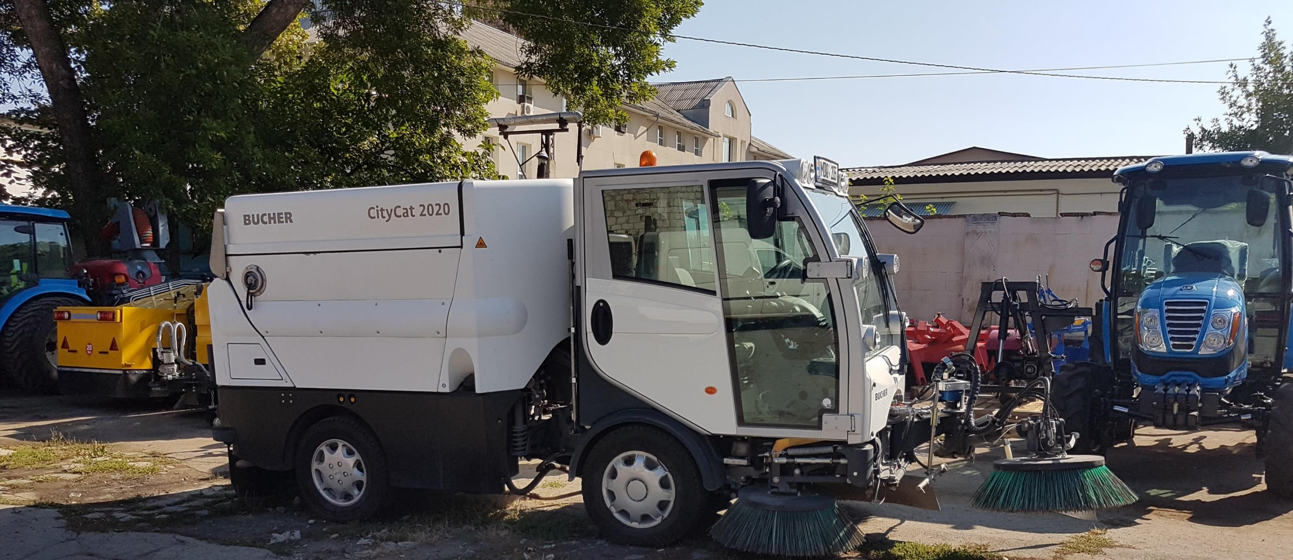
Mașină multifuncțională BUCHER CityCat 2020