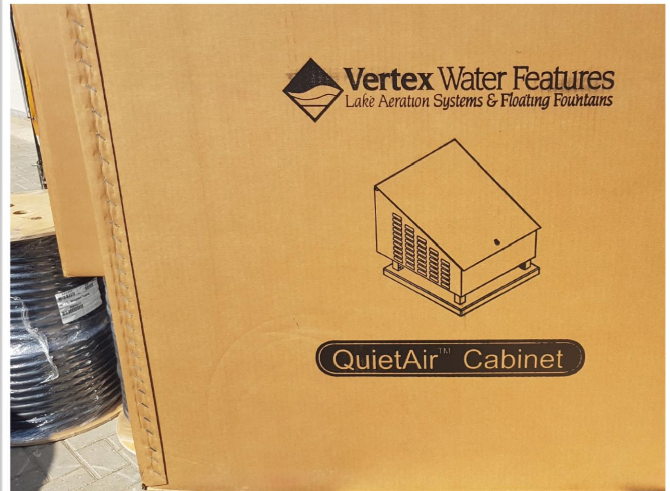
Aeratoare pentru lacul din Parcul „Valea Morilor” (compresoarele)