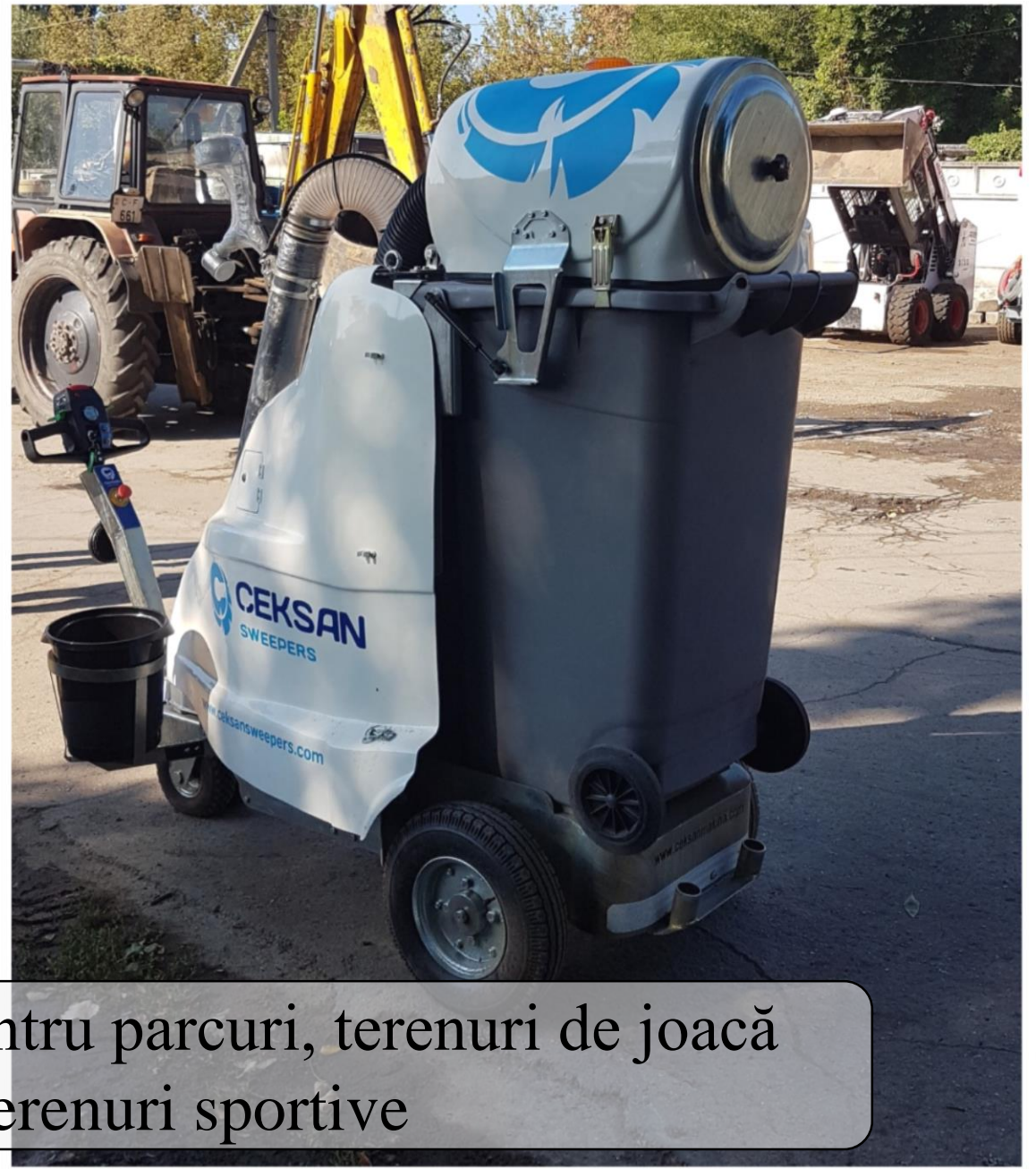
Aspirator electric manual pentru parcuri, terenuri de joacă pentru copii, terenuri sportive