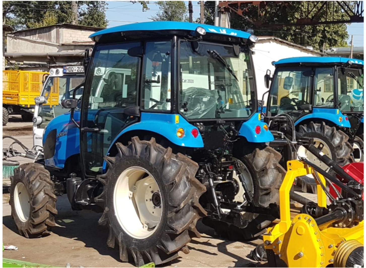
Tractoare (2 unități)