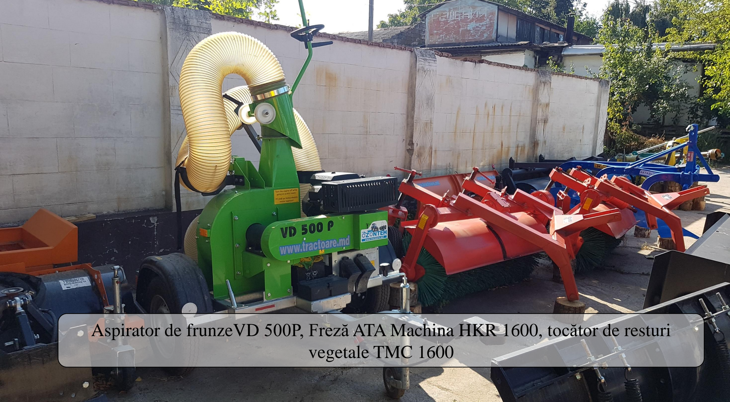
Aspirator de frunze VD 500P, Freză ATA Machina HKR 1600, tocător de resturi vegetale TMC 1600